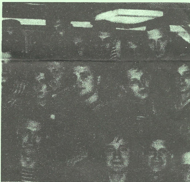
Photo de l'équipage du Koursk.